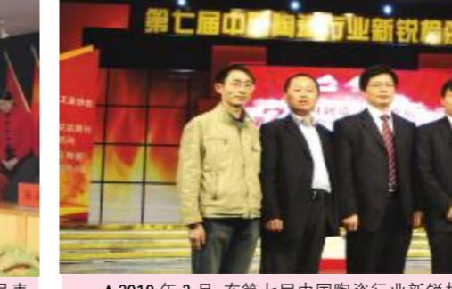
▲2010年3月,在第七届中国陶瓷行业新锐颁奖典礼上,湖南天欣集团一举获得五大大奖:鸿双喜陶瓷(新锐品牌奖)、金达雅(新锐品牌奖)、天欣科技(优秀企业奖)、金达雅·曙光陶瓷(新锐产品奖)、天欣科技挂牌上市(新锐事件奖)!