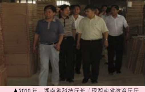
▲2010年,湖南省科技厅厅长(现湖南省教育厅厅长)王柯敏在岳阳县委书记刘洪斌、县委书记刘洪斌的陪同下亲临天欣科技调研和指导工作。