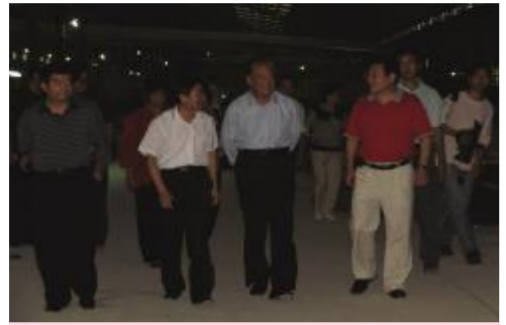
▲全国政协副主席毛致用在省、市、县领导的陪同下亲临湖南天欣集团视察!