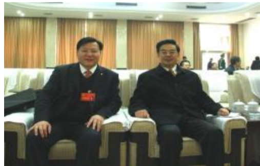
▲湖南省人大代表、董事长王五星和中共湖南省委书记、省人大主任周强在省人大会议上。