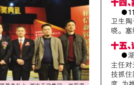
▲2010年3月,在第七届中国陶瓷行业新锐颁奖典礼上,湖南天欣集团一举获得五大大奖:鸿双喜陶瓷(新锐品牌奖)、金达雅(新锐品牌奖)、天欣科技(优秀企业奖)、金达雅·曙光陶瓷(新锐产品奖)、天欣科技挂牌上市(新锐事件奖)!