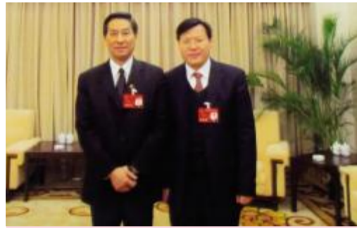
▲湖南省人民政府副省长陈肇雄和湖南省人大代表、湖南天欣集团董事长王五星合影。