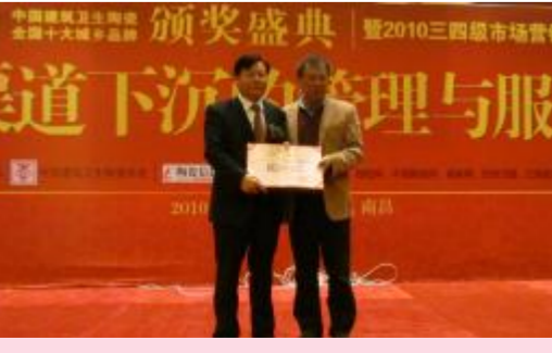
▲在中国建筑陶瓷全国十大城乡颁奖典礼上,“鸿双喜陶瓷”被评为“全国十大城乡品牌”。