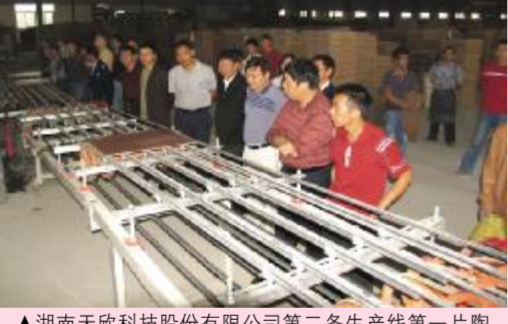
▲湖南天欣科技股份有限公司第三条生产线一片陶瓷顺利下线。岳阳市人大副主任陈国荣亲临天欣科技调研和指导工作。