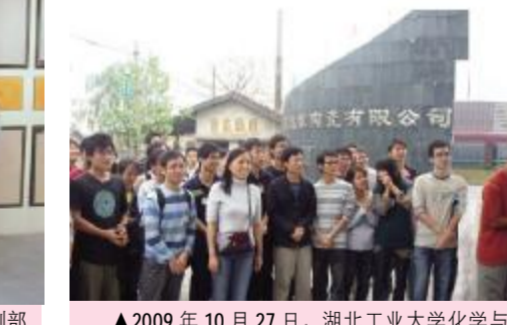
▲2009年10月27日,湖北工业大学化学与环境工程学院实践教学基地暨校企人才培训与就业合作签约仪式在岳阳市金达雅陶瓷有限公司隆重举行。自合作以来,学院先后为企业输送4批次,共100多名大学生充实到各个生产和科研岗位!