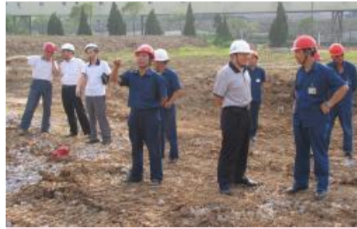
▲2006年10月10日,湖南天欣科技股份有限公司正式签约落户岳阳新墙农业工业园!