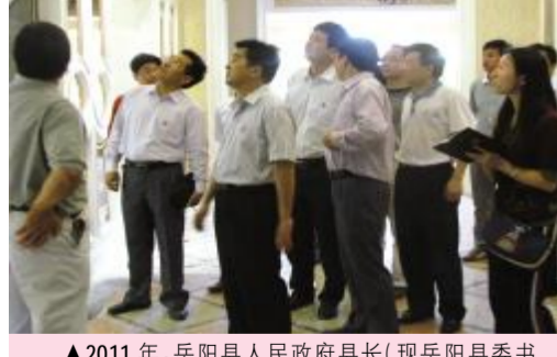
▲2011年,岳阳县人民政府县长(现岳阳县委书记)黎四清等领导亲临湖南天欣科技股份有限公司调研和指导工作!