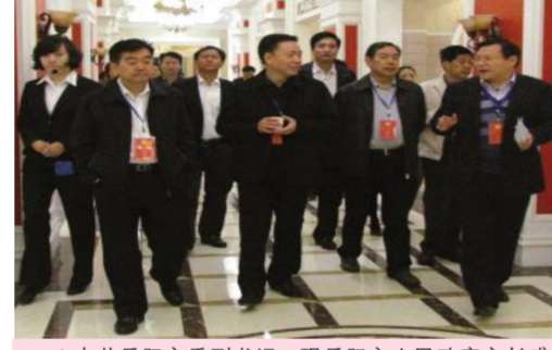
▲中共岳阳市委书记,现岳阳市人民政府市长盛军,现岳阳市委书记黄兰香等领导亲临湖南天欣科技股份有限公司调研和指导工作。