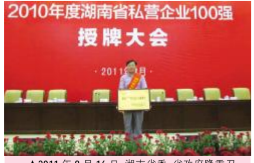
▲2011年8月16日,湖南省委、省政府隆重召开表彰大会,授予二重天欣科技等100家民营企业为“湖南省民营百强企业”。