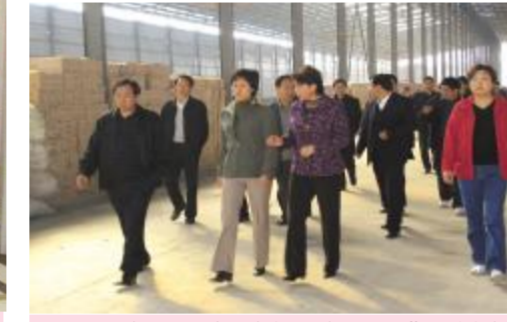
▲岳阳市人民政府原市长、现市委书记黄兰香在市委书记康代四、副市长陈国庆、宋爱华等领导的陪同下亲临湖南天欣科技股份有限公司调研和指导工作。