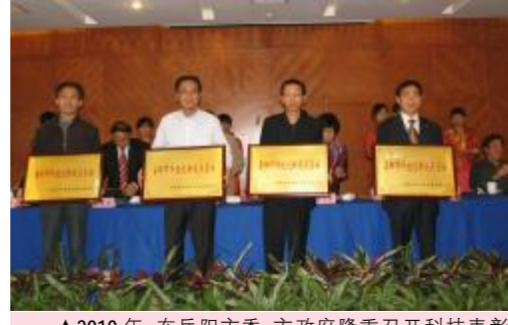
▲2010年,在岳阳市、市政府隆重召开科技表彰大会上,岳阳市金达雅陶瓷有限公司和湖南天欣科技股份有限公司获得“科技进步奖”!