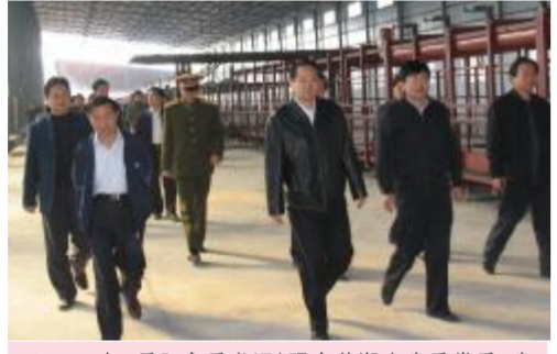
▲2009年,岳阳市委书记(现中共湖南省委常委、省委秘书长、省直机关工委书记)易炼红亲临湖南天欣科技股份有限公司调研和指导工作。