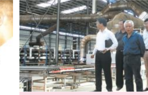
▲国家工商行政管理总局副局长甘国屏,在省、市、县工商和相关部门的陪同下亲临湖南天欣科技股份有限公司指导和检查工作!