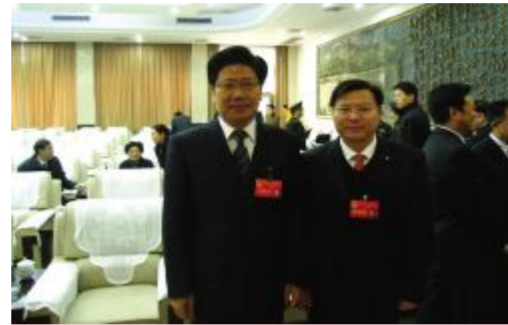
▲中央委员、新疆维吾尔自治区党委书记张春贤同湖南省人大代表、董事长王五星合影!