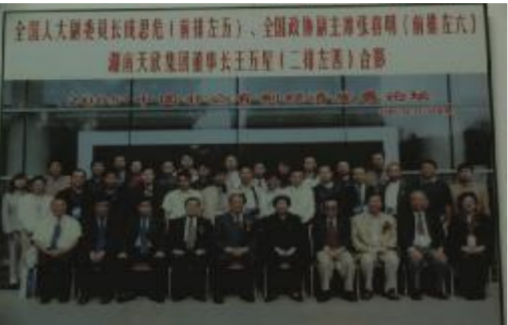
▲董事长王五星同全国人大副委员长成思危、全国政协副主席张榕明合影!