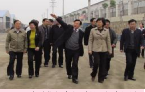
▲2011年,中共岳阳市委副书记、岳阳市人民政府市长盛军,现岳阳市委书记黄兰香等领导亲临湖南天欣科技股份有限公司调研和指导工作。