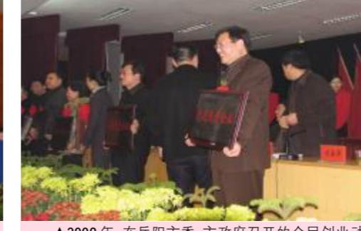
▲2009年,在岳阳市、市政府召开的全民创业动员表彰大会上,湖南天欣陶瓷有限公司(湖南天欣科技股份有限公司前身)被授予“先进民营企业”!